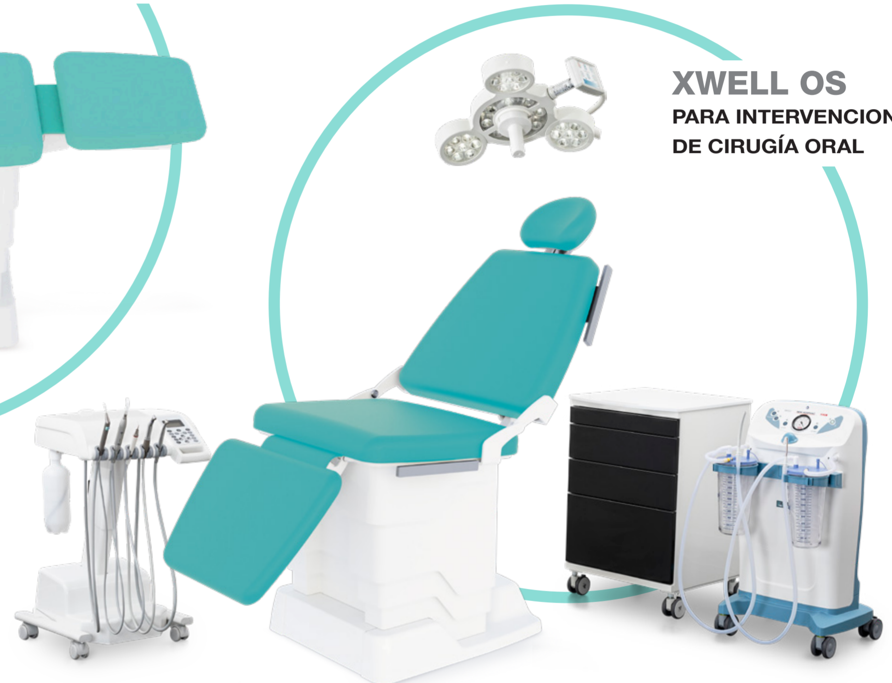
XWELL OS PARA INTERVENCIONES DE CIRUGÍA ORAL