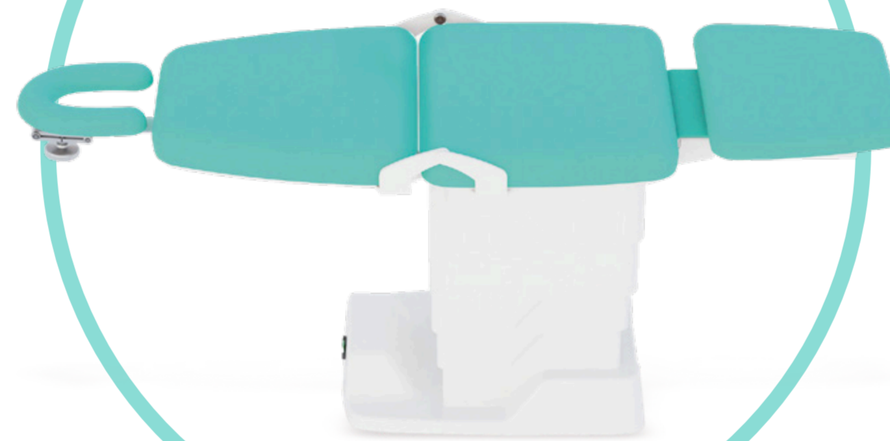
XWELL AES PARA PROCEDIMIENTOS MÉDICO-ESTÉTICOS