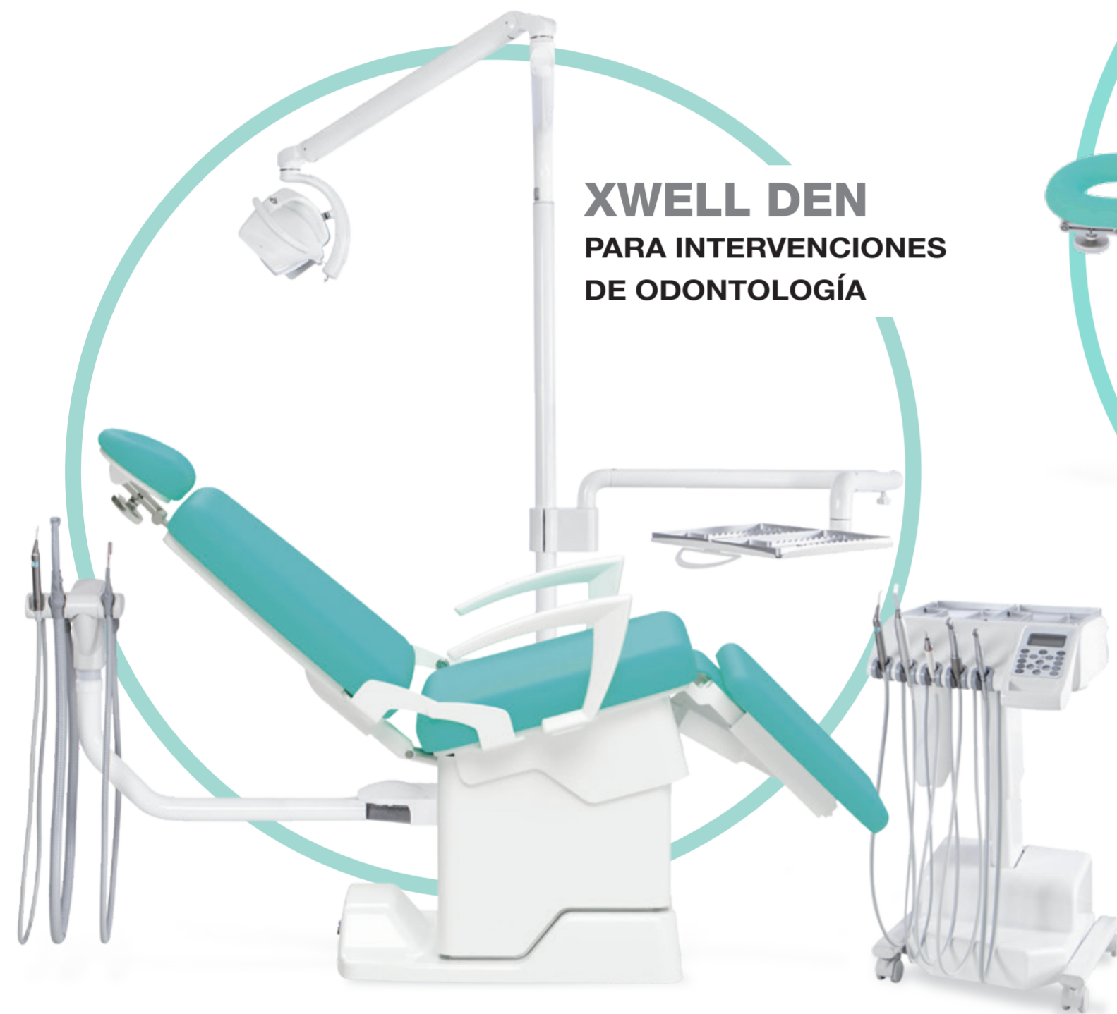
XWELL DEN PARA INTERVENCIONES DE ODONTOLOGÍA

El único sillón polivalente para la asistencia sanitaria